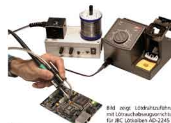
Bild zeigt Lötdrahtzuführung mit Löt Rauchabsaugvorrichtung für JBC LötKolben AD-2245