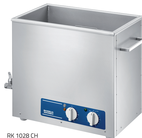
RK 1028 CH

Cuves à ultrasons de haute puissance pour le nettoyage ou le traitement des échantillons dans solutions aqueuses