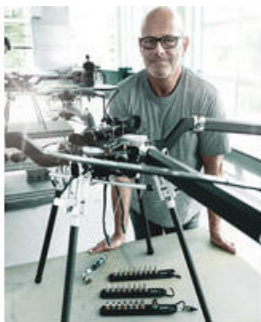
Die Wera Belts